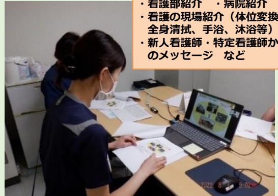
茨城県内の高校生60名（全3回）